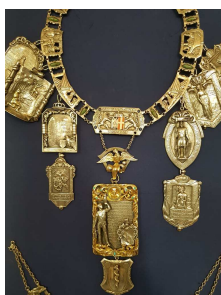
Foto: Neusser Schützenkönigschleife

Die Königschleife des Neusser Schützenkönigs wird nur zu 4 Anlässen im Jahr getragen. Die restliche Zeit wird sie in einer alarmgeschützten Ausstellungsverglasung im Schützenmuseum aufbewahrt.