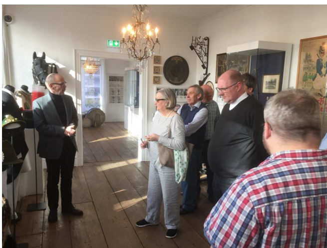
Foto: Führung durch das Schützenmuseum Neuss

Im Rahmen einer Führung ab 16:30 haben wir das Schützenwesen vom Mittelalter über die frühe Neuzeit bis in die Gegenwart erklärt bekommen. Auch lernten wir die unterschiedlichen Gruppierungen und Corps des „Neusser Bürger-Schützen-Verein“ mit den dazugehörigen Uniformen kennen.