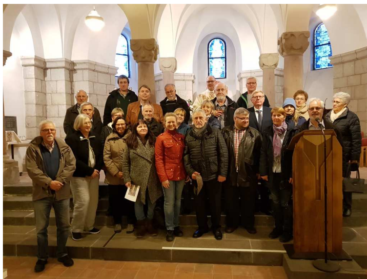
Foto: Krypta des Quirinusklosters in Neuss

Den Tag in Neuss beschlossen wir dann mit einem Besuch in einem auch für das Schützenwesen bedeutendem Gasthaus in Neuss zum Abendessen. Um 19:00 Uhr wurden wir in dem Brauhaus „Vogthaus“ erwartet.